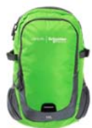
Stel Backpack 14L

Para rebater em produtos de Detecção Telemecanique.